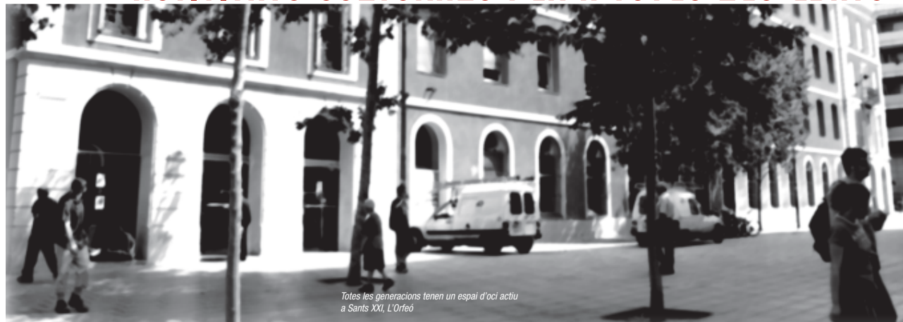
Totes les generacions tenen un espai d'oci actiu a Sants XXI, L'Orfeó

"Sants XXI, L'Orfeó, un projecte de futur amb història" una de les millors maneres d'apropar-nos a l'Orfeó