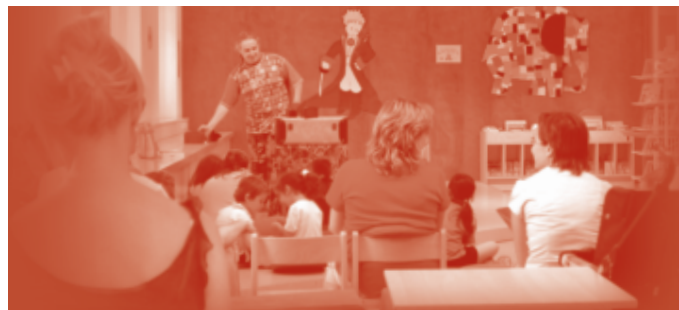
Contacontes a la Biblioteca Vapor Vell Una de les activitats de Sants XXI, L'Orfeó més celebrades pels menuts

Comenceu a treure la pols als objectius, perquè l'ocasió de ser el primer vencedor s'acosta!