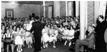
El President Macià en visita a l'Orfeó.

Entre tots podem aconseguir que les portes d'una entitat històrica com la nostra s'obrin de bat a bat i, amb elles, acostem Sants a la gent que estima la cultura.